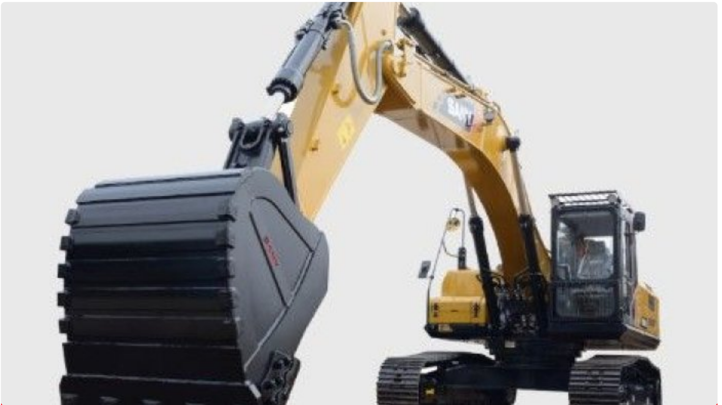
Gambar Ilustrasi Exavator Merk Sany